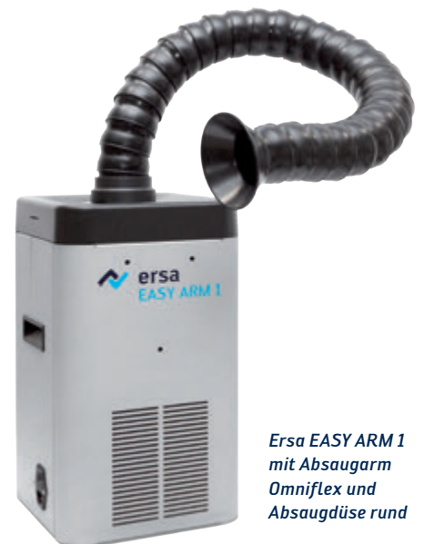
Ersa EASY ARM 1 mit Absaugarm Omniflex und Absaugdüse rund

Zur längeren Nutzung der Filter und zur Energieeinsparung können beide Geräte über eine Schnittstelle mit Ersa i-CON-Lötstationen oder einem Standby-Schalter verbunden werden. So wird die jeweilige Absaugung nur dann betrieben, wenn mit der angeschlossenen i-CON-Lötstation gearbeitet wird.