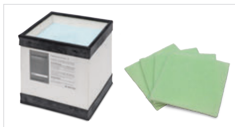
Hochwertige Filtermaterialien, baugleich für Ersa EASY ARM 1 und EASY ARM 2